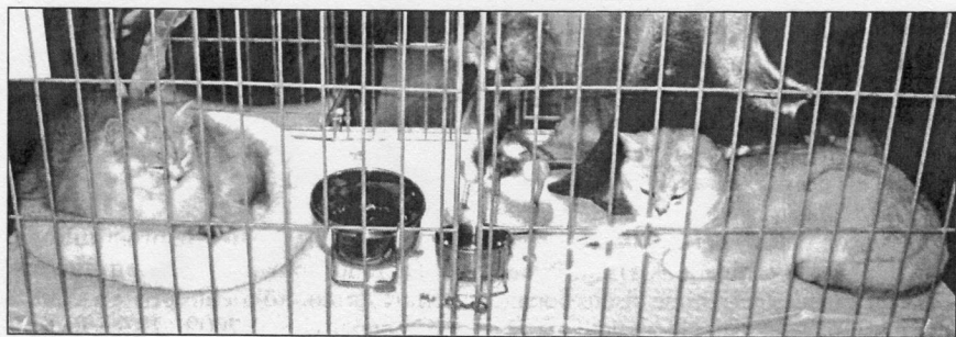
Calypso (British Longhair) et Rembrandt vum Rousegaard (British Shorthair)